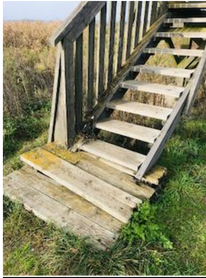
2. Brakuje bardzo dużo desek w barierkach