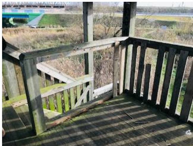
3. Uszkodzona deska w podłodze